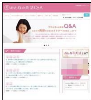
みんなの美活・トップページ

美容Q&Aサイト『みんなの美活』は、例えば【もうメイクで隠せない肌のくすみ】【「眠いの？」って聞かれる一重】【プルプルする下腹と二の腕】【治りにくく、何度も繰り返す大人ニキビ】など、女性なら誰もが悩んでいてもおかしくない様々な悩みや疑問を「質問」として投稿すると、それを解消・治療するためのアドバイスや方法を“美容医療のプロ”が「回答」する、という仕組みです。