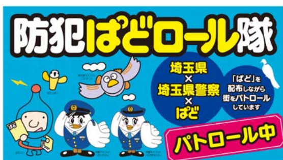
写真③ 多目的プレートイメージ