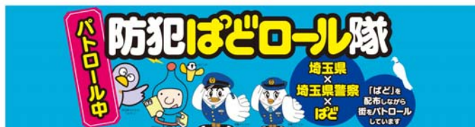
写真② 防犯腕章イメージ